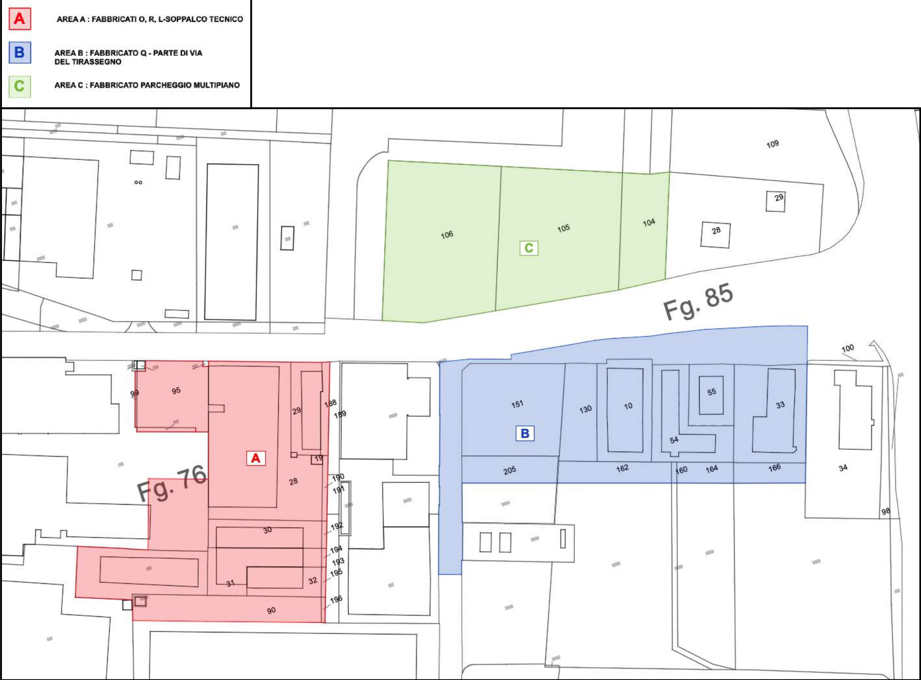
Catastali con aree intervento